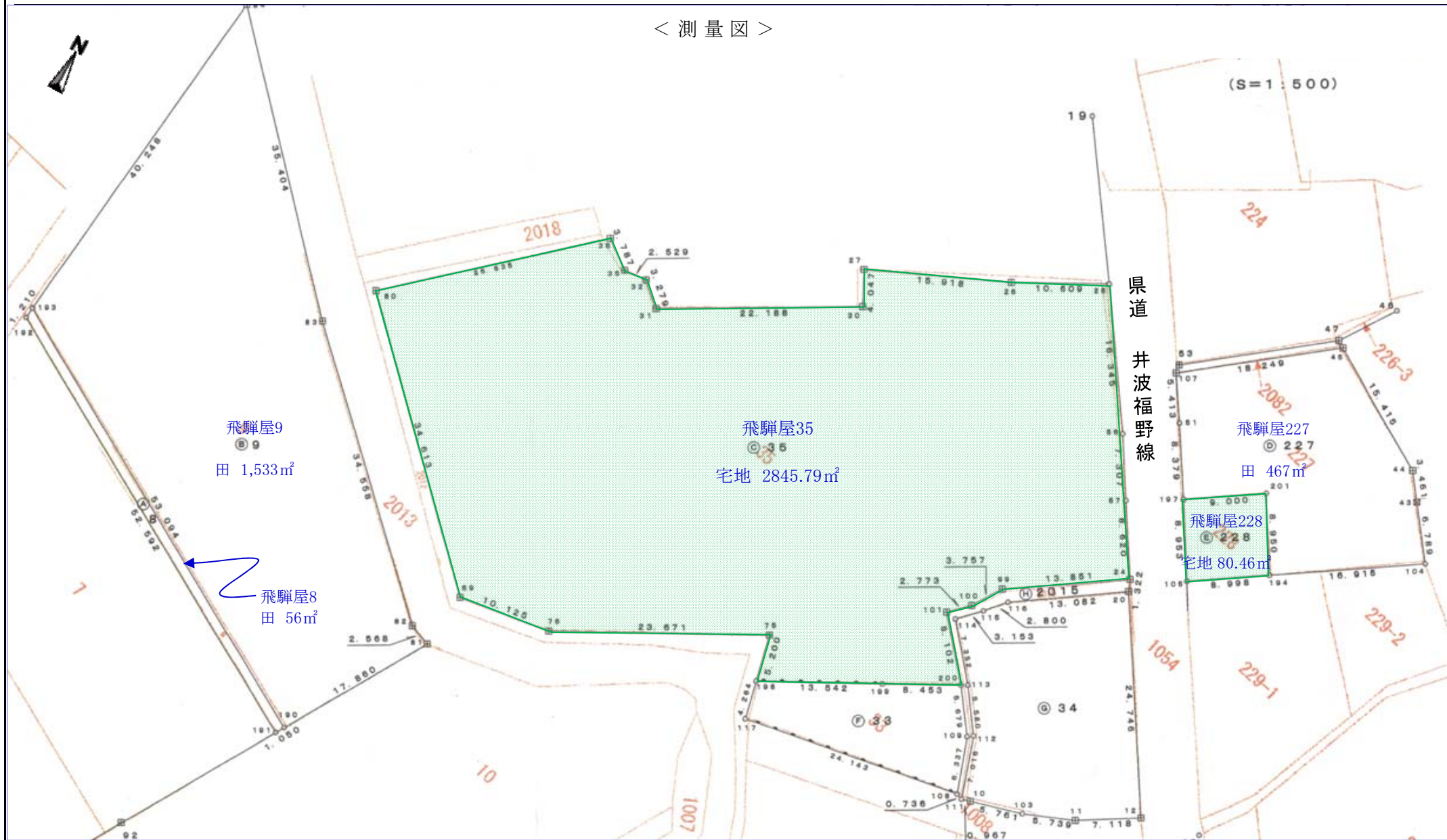
< 測量図 >